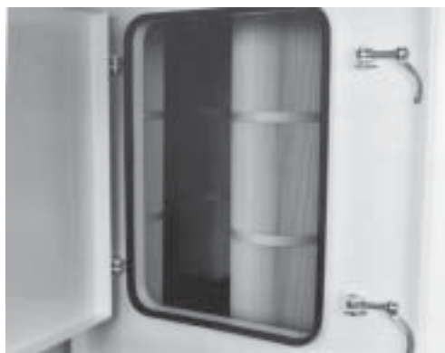
Porta de abertura rápida com selo de resistência.